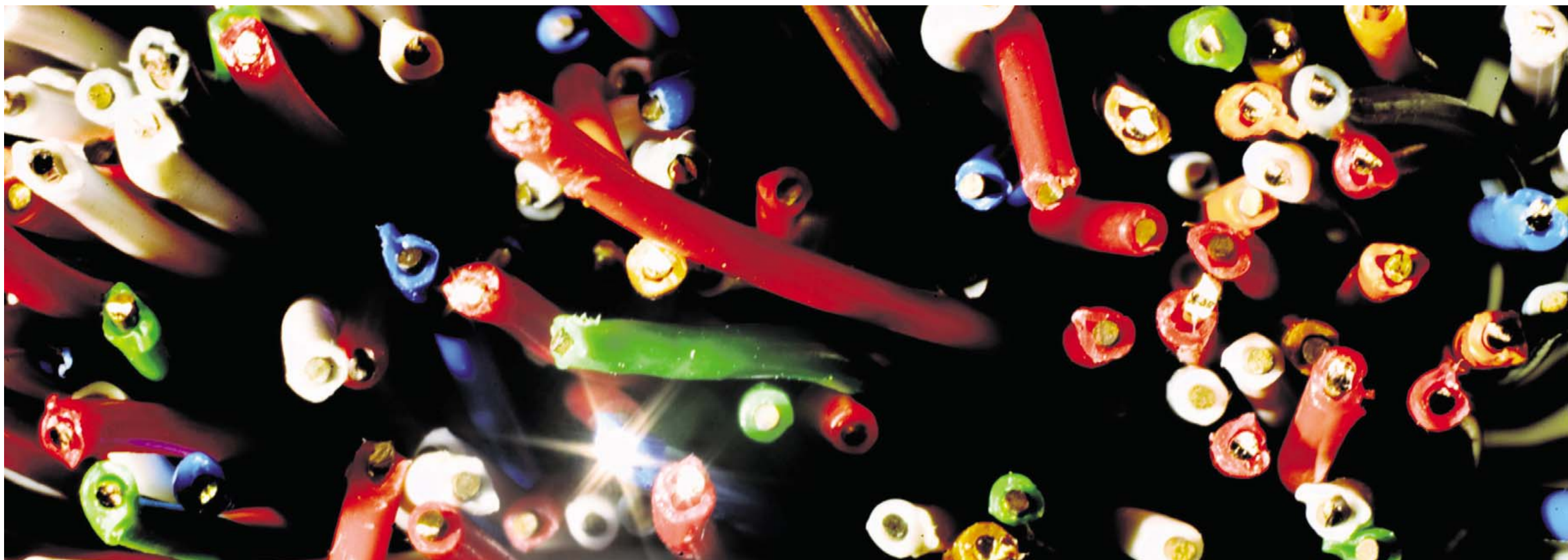
LEDNINGSNET. Hurtige bredbåndsforbindelser er blevet et stort attraktiv for kommunerne. Det kan trække både flere borgere og mere erhverv til. Hvis den digitale infrastruktur derimod ikke fungerer, søger de andre steder hen.